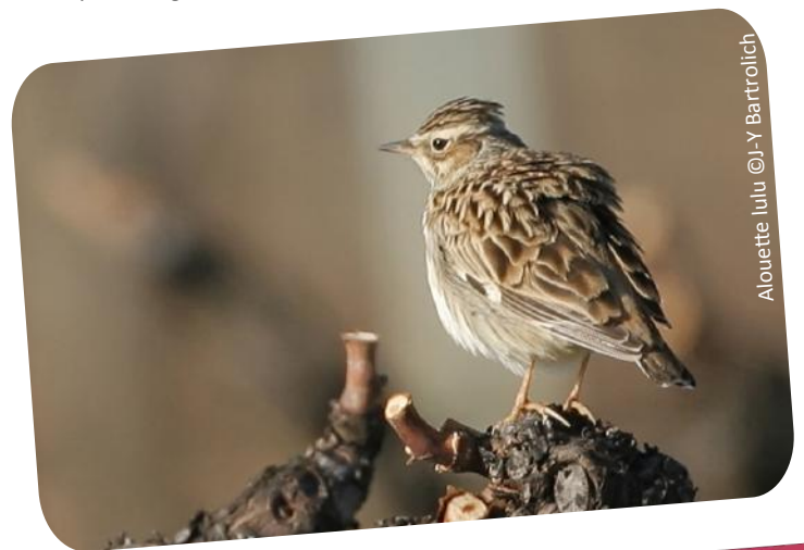
Alouette lulu

D'autres conférences et sorties seront proposées en 2018 pour poursuivre le travail de sensibilisation aux oiseaux du site. De plus, l'exposition sur les Oiseaux des Corbières continuera à cheminer sur le territoire. Rappelons d'ailleurs qu'elle peut être empruntée gratuitement sur demande.